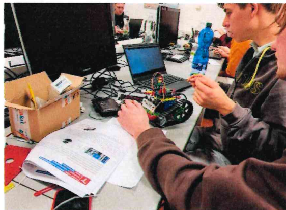
Obrázek 6 Žáci a jejich vítězný robot