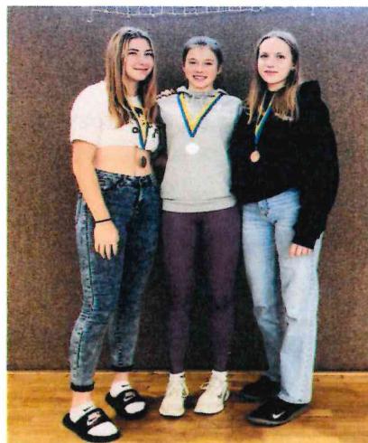
Obrázek 9 Vítězky přespolního běhu