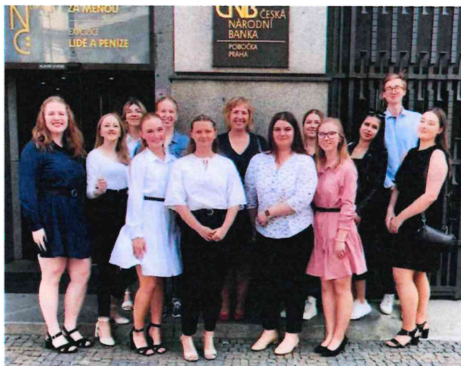
Obrázek 12 Družstvo soutěže Rozpočti si to

Ve finále museli soutěžící představit svou herní domácnost a její celoroční hospodaření, popsat hlavní získané poznatky a odpovědět na otázky tříčlenné odborné poroty. Finálové body se přičítaly k bodům ze základního kola.