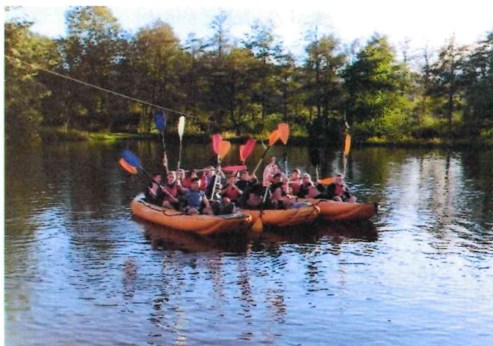
Obrázek 1 Žáci na adaptačním kurzu

Adaptační kurz pro první ročníky součást SOU proběhl během měsíce září v areálu školy na Sovadinově ulici a blízkém okolí. Hned od druhého školního dne začala sportovní část, která proběhla na školním hřišti. Necelá stovka nových žáků si mohla zahrát fotbal, dívky daly přednost přehazované. Preventivní protidrogové aktivity zajistilo K centrum v Břeclavi, se kterým dlouhodobě spolupracujeme. V rámci AK mohli žáci besedovat také na téma AIDS, seznámili se s VP a ŠMP. Žáci z KAD1 navštívili v Čejkovicích Sonnentor. Žáci se díky AK seznámili s novými učiteli, novou školou, dílnami i mezi sebou navzájem.