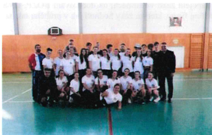
Obrázek 18 Sportovní den s partnerskou školou