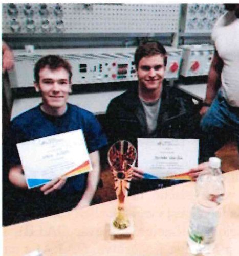
Obrázek 14 Účastníci regionální soutěže