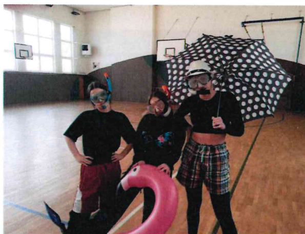
Obrázek 16 Kostýmy na Den imunity

Schůzky Studentského parlamentu se konaly jednou za dva měsíce. Kromě organizace výše uvedených akcí na nich zástupci jednotlivých tříd diskutovali o tématech týkajících se chodu školy a života jednotlivých třídních kolektivů.