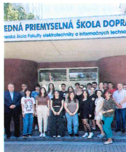
Obrázek 19 Návštěva partnerské školy