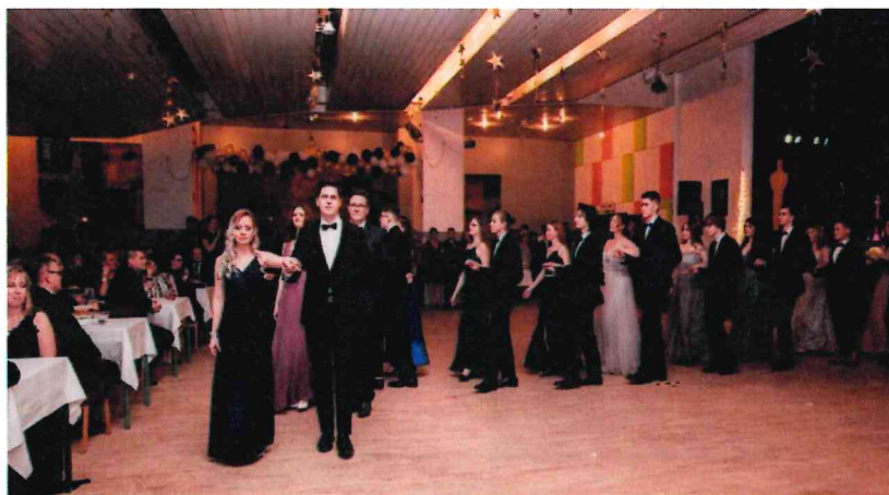
Obrázek 3 Polonéza na školním plesu