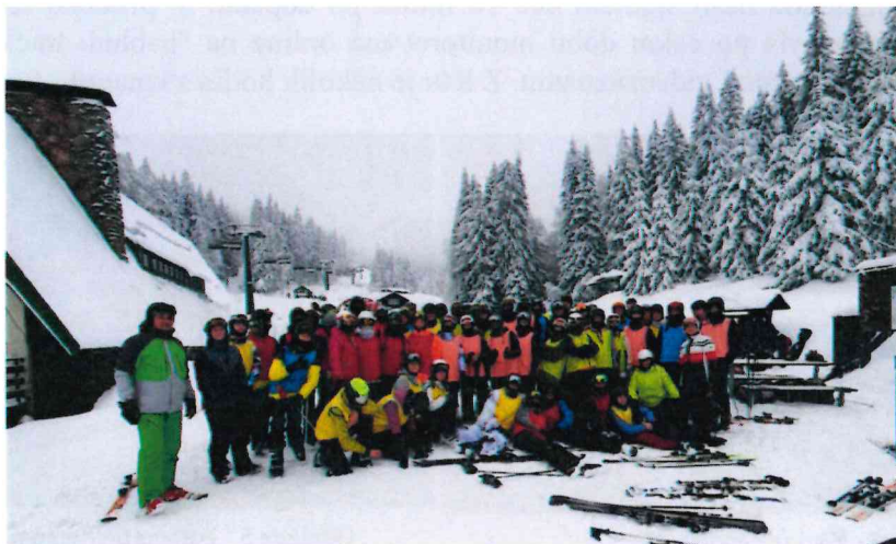
Obrázek 2 Žáci na LVK v Říčkách

V letošním školním roce se lyžařského kurzu pořádaného v termínu 28. 1.– 2. 2. 2023 zúčastnilo celkem 72 žáků. Kurz proběhl v Říčkách – Orlické hory. Ubytování jsme byli v chatě Lorien, která se nachází v Nekoři. V rámci programu byly každý večer pořádané odborné přednášky, další večerní program probíhal dle stanoveného plánu kurzu, kterého se účastnili všichni žáci. Cíl výcviku – naučit a zdokonalit schopnosti žáků v lyžování – byl splněn.