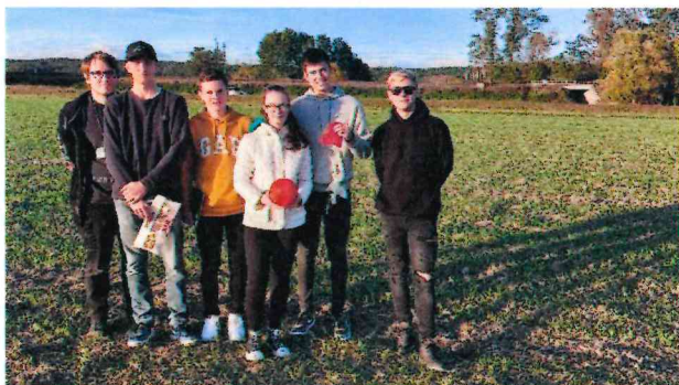
Obrázek 4 Žáci se sondou TTS3