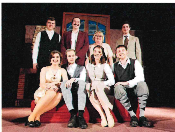
Obrázek 17 Divadelní představení Deset malých černoušků